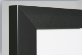
Satin grey gebürstet