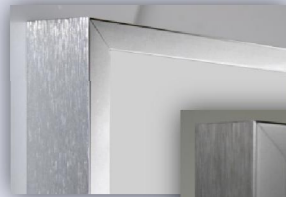
Chrom eckig, Seite gebürstet