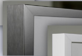
Titan eckig, Seite gebürstet