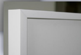
Weiß eckig, pulverbeschichtet