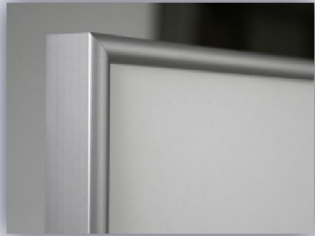
Standardrahmen silber eloxiert